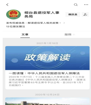
桓台县退役军人事务局2020年主动公开数据统计