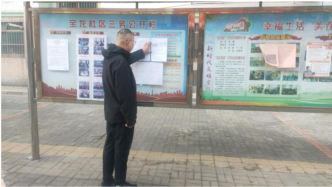
图5 公告栏张贴（3月6日）

我单位于2024年3月6日选取离项目建设地址较近的村庄宝龙社区张贴第二次公众参与公告，张贴地点为公众较为关注的公开栏，符合《环境影响评价公众参与办法》要求。公示照片如下：